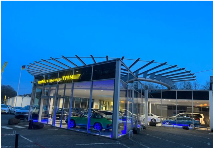
BILDER FOLGEN IN KÜRZE